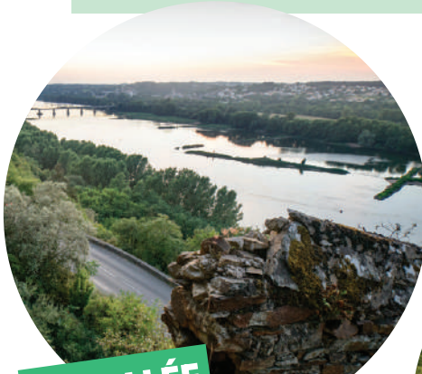
LA VALLÉE DE LA LOIRE

Keep cycling beyond Ancenis to Champtoceaux for a stunning view of the Loire River from the Champalud garden.