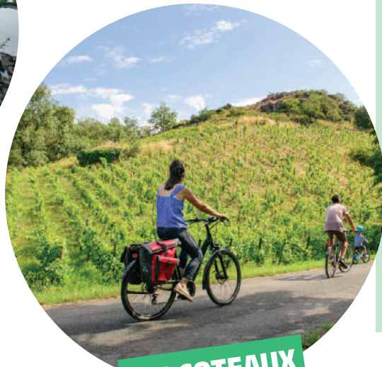
LES COTEAUX DU LAYON