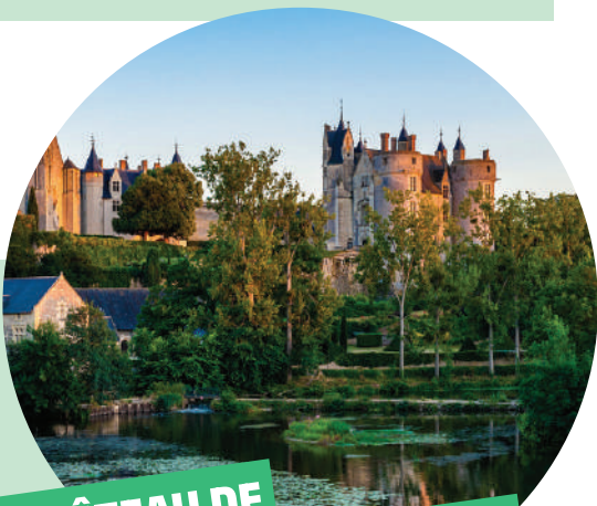
LE CHÂTEAU DE MONTREUIL-BELLAY

For a refreshing break, try your hand at canoeing & kayaking on the Loire River.