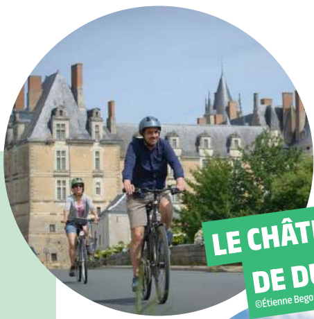
LE CHÂTEAU DE DURTAL

After Vaulandry, take a break in Baugé to visit the Hôtel-Dieu apothecary museum and King René's palace.