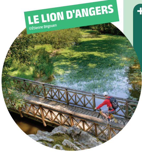
LE LION D'ANGERS