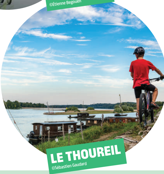
LE THOUREIL